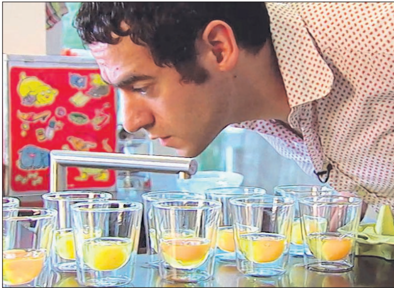
Zitten er rode puntjes in de eieren?